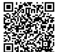
携帯用申込フォーム